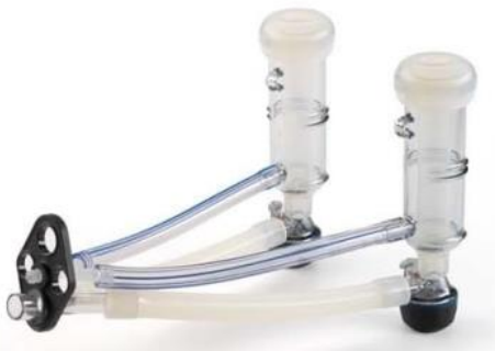
Classic Goats ITP205-SIM

Griffes individuelles avec clapet entièrement automatique aussi bien pendant la traite que pendant le lavage. Au moment où le manchon trayeur touche la tétine, le clapet s'ouvre instantanément. Après quoi, quand le clapet se détache de la tétine, l'entrée d'air rapide crée un vide entraînant le clapet sur son siège.