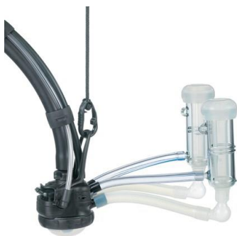
ITP206 Goats High Line