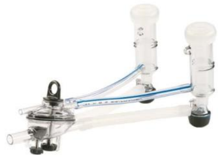
Vanguard Goats ITP205-SIM